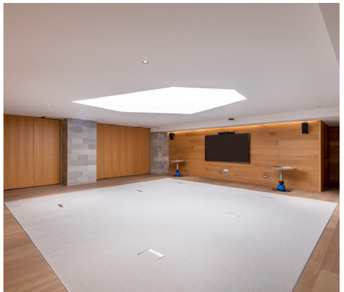
W Studio 3