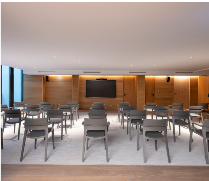
W Studio 1 - Plateia