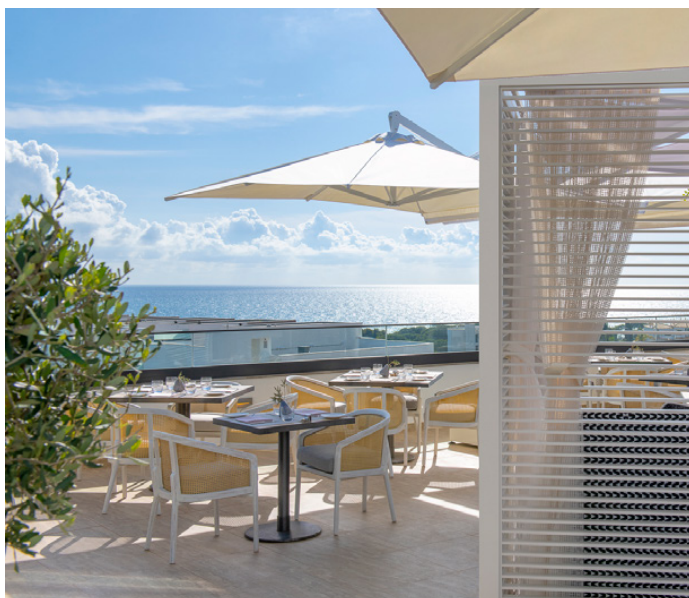
Restaurante Paper Moon - Terraço