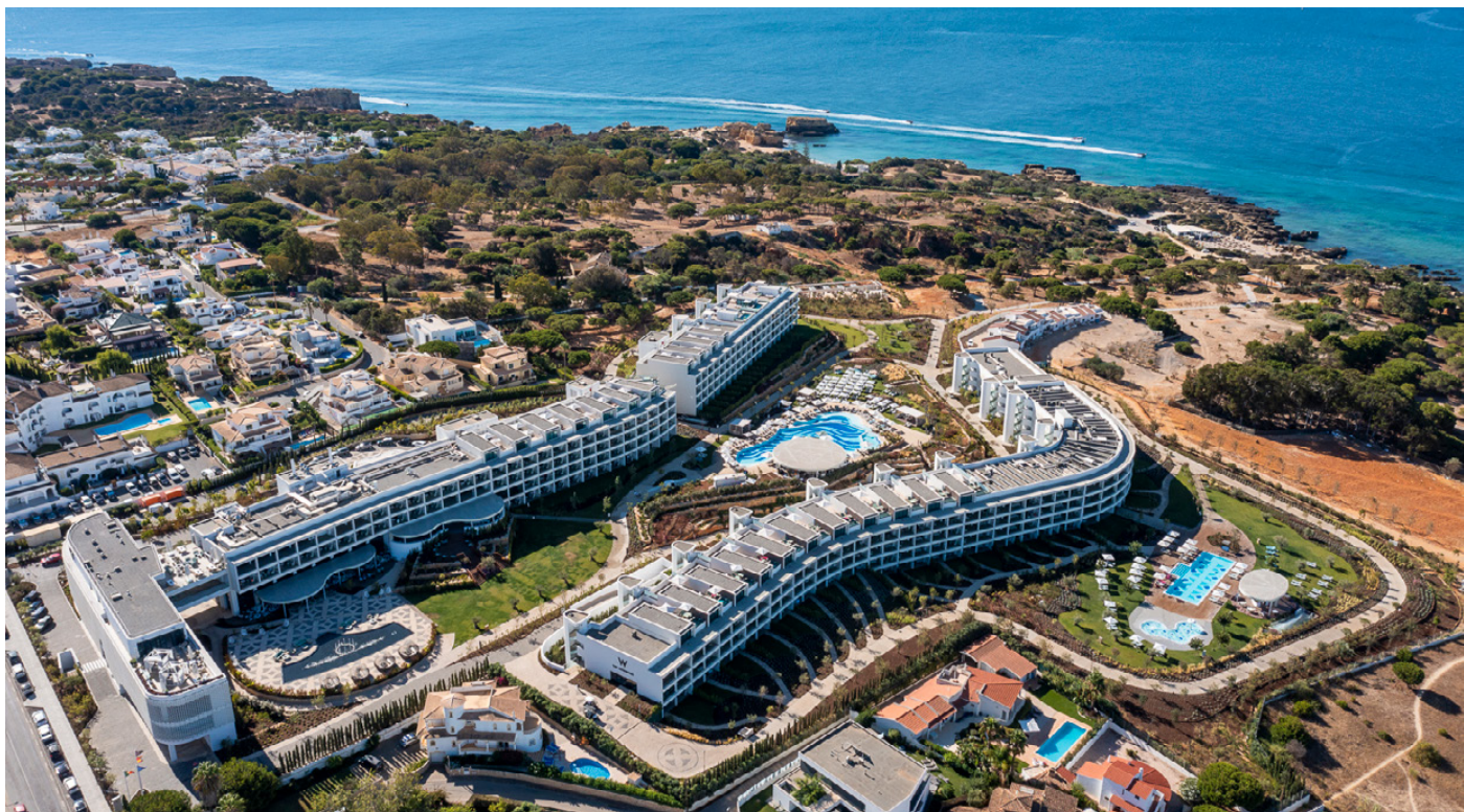
W Algarve - Vista Aérea