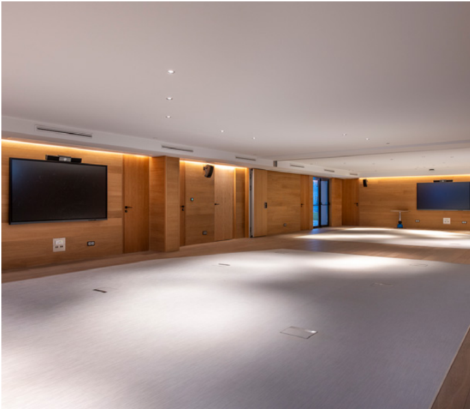
W Studios 1 & 2