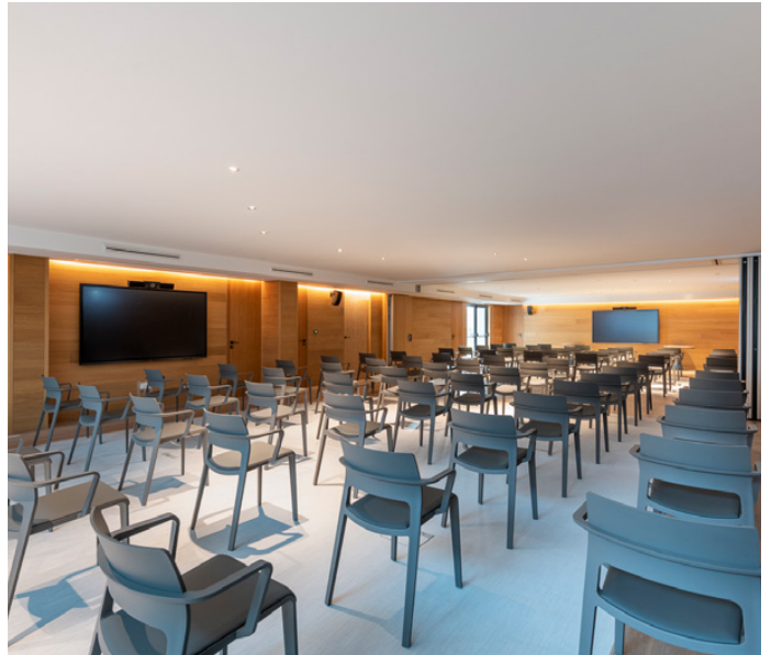
W Studios 1 & 2 - Plateia