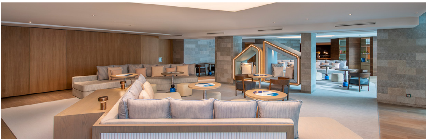
W Studio 4 & Foyer